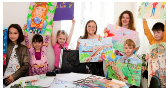
Проект по приложни изкуства