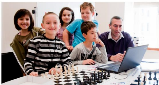
Проект по шахмат